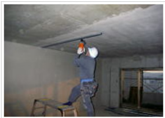
5、スラブ：ランナー取り付け