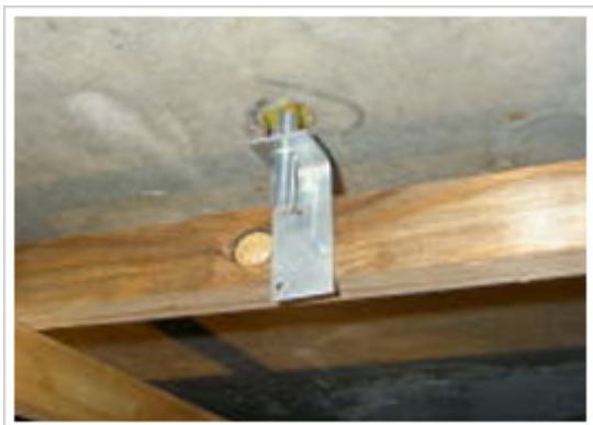
25、天井：吊り金具取付