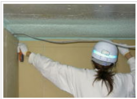
19、天井：天井ライン墨出し