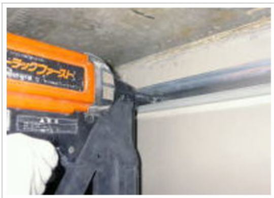
21、天井：ランナー取付