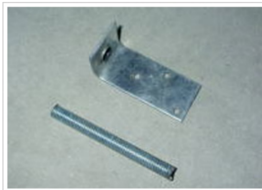
24、天井：天井吊り金具