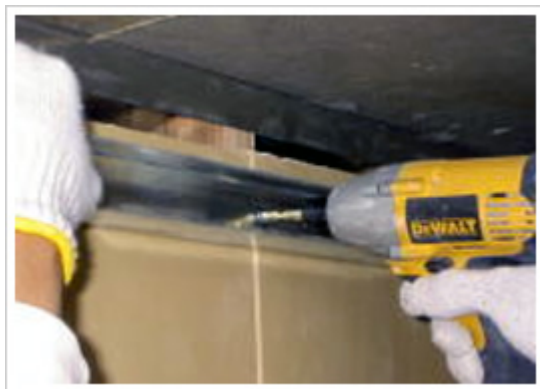
20、天井：ランナー取付