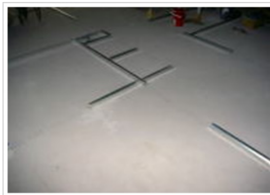
6、床：ランナー取り付け