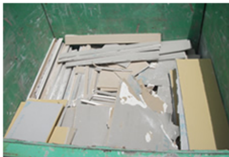
ボード産廃集積状況「整理整頓」